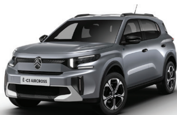
Šedá MERCURY (M)