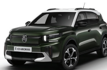
Zelená MONTANA (M)